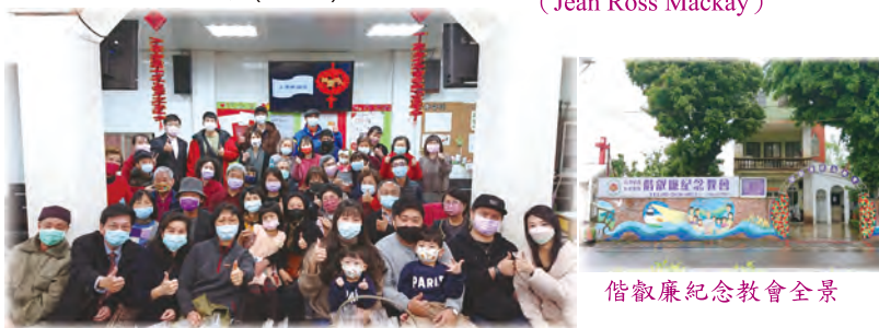
偕叻廉紀念教會2022新春禮拜全體信徒大合照