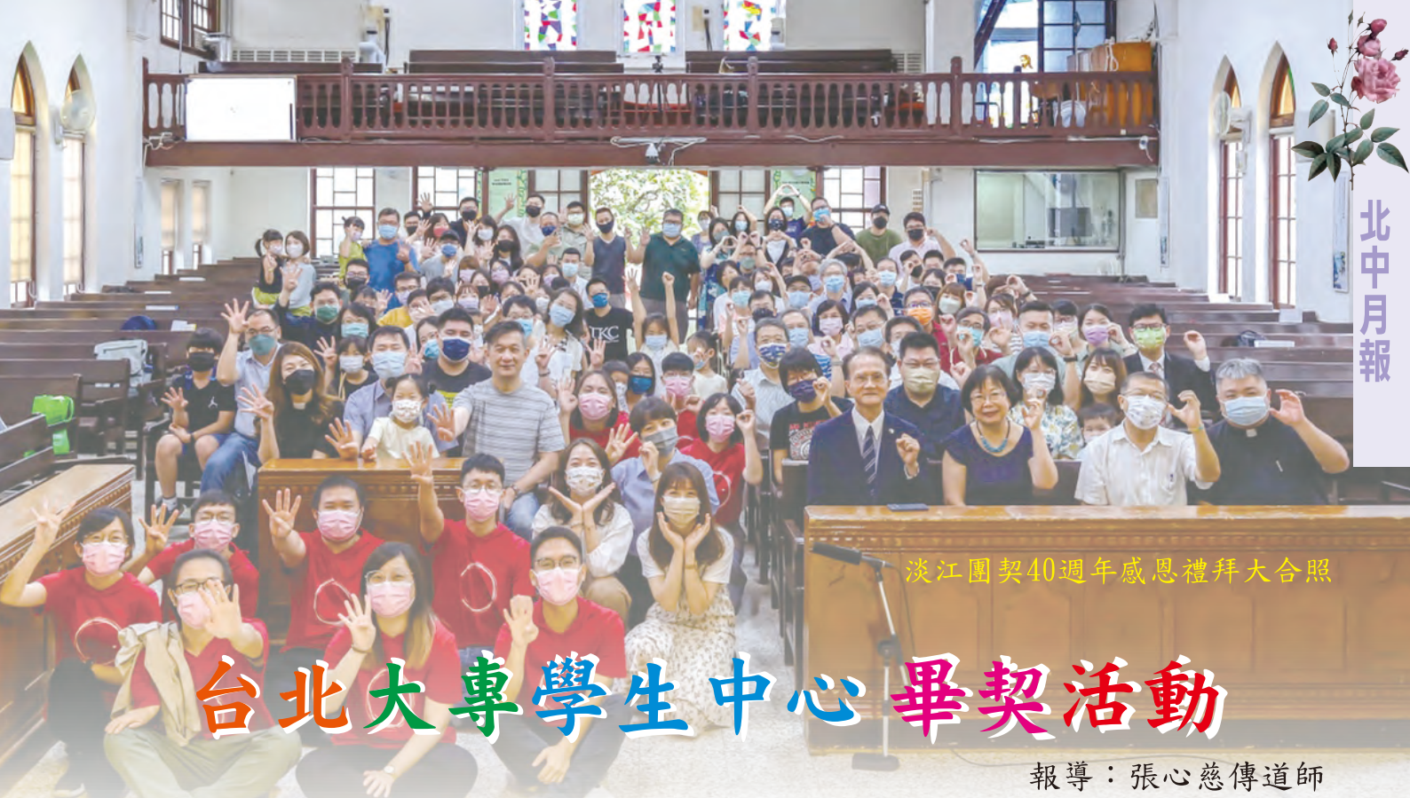
淡江團契40週年感恩禮拜大合照